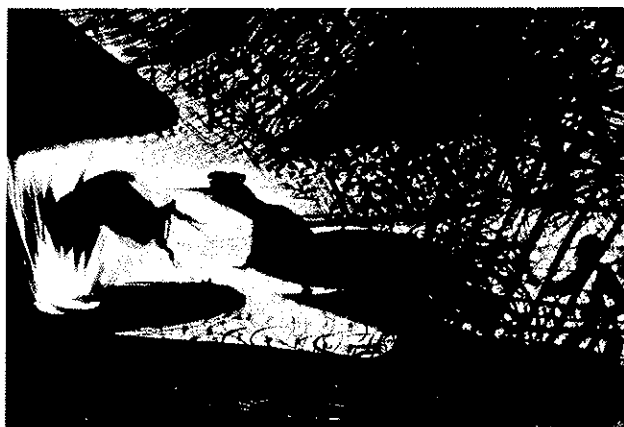
III. Von Lorenzo Mattotti (Hänsel und Gretel)